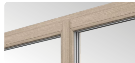
I profili snelli con montante stretto dotati di doppia guarnizione costituiscono una novità in questo tipo di soluzioni presenti sul mercato.