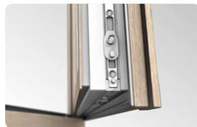
Ferramenta Maco Multi Matic KS di alta qualità con due perni antisfondamento di serie.