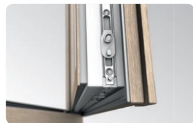
Hochwertige Maco Multi Matic KS Beschläge mit zwei aushebungs-sicheren Schließblechen als Standardausstattung.