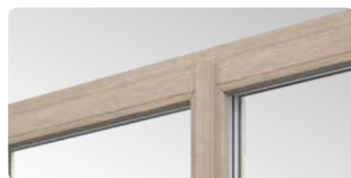
Štíhlé profily s úzkým sloupkem vybaveným dvojitým těsněním, je novinkou na trhu u řešení tohoto typu.