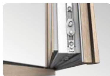
Vysoce kvalitní kování Maco Multi Matic KS ve standardu dva bezpečnostní uzávěry proti vypáčení.